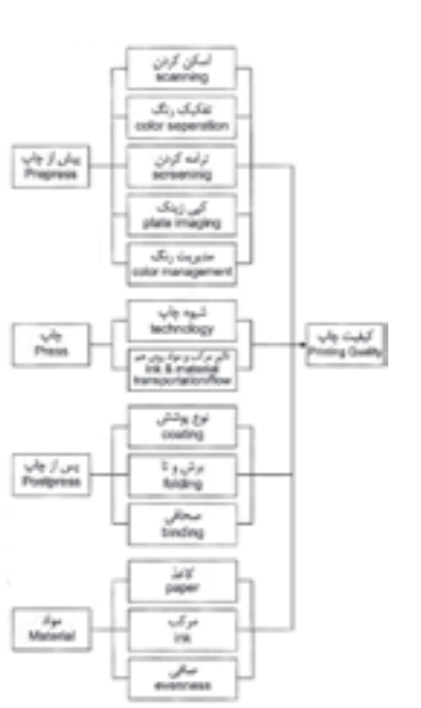
نمودار ۱:عوامل تأثیرگذار بر کیفیت چاپ ماخذ:(عفرایی ، ۱۳۸۳ ، ۱۵)

امادر «لیتوگرافی»مدرن ، زمانی کهسند چاپی از طریق نرم‌افزارهای رایانه‌ای تهیه شود و یا نمونه‌ی دستی ، «اسکن» [۲۲] شده و نسخه‌ی «دیجیتال» تهیه گردد ، بسته به نوع دستگاه چاپ و نرم‌افزار مورد استفاده ، باید نسخه‌ی چاپی را با فرمتی که برای دستگاه چاپ شناخته شده باشد مانند «بی‌دی‌اف» [۲۳] ، تهیه نمود. در این مرحله ، توسط دستگاه