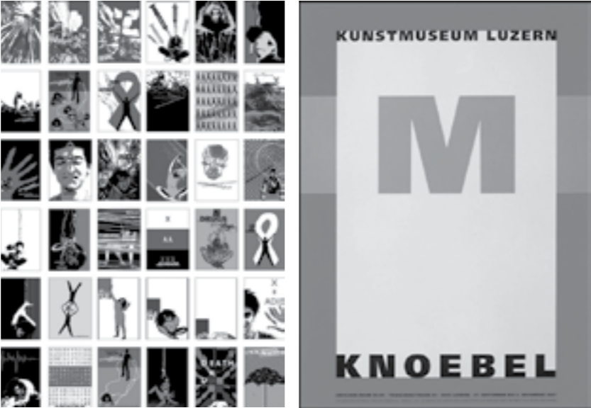
تصویر‌شماره‌ی ۱:حروف‌نگاری،نمایشگاه‌هنری‌ایمی‌کنویل، ملخیور ایمبودن (Melk Imboden)، سوئیس، ۱۹۹۷م.

زمانی کوتاه می‌شود.راز نهفته در این طرح‌ها ، در فکرهای لحظه‌ای است که به‌عنوان تفکرات ناب و خام به ثبت می‌رسد.